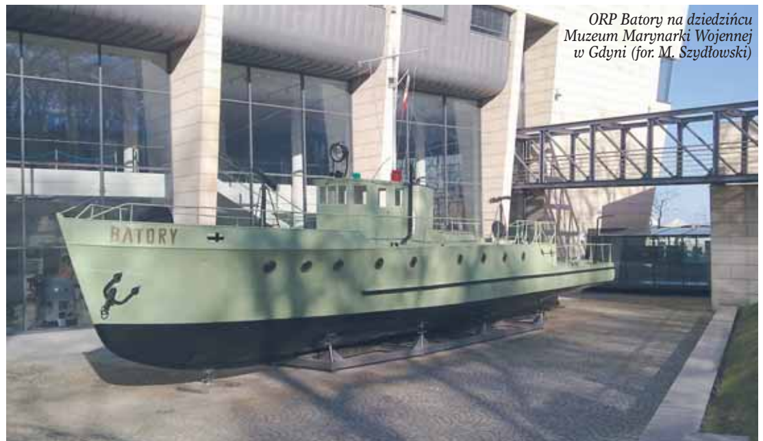
ORP Batory na dziedzińcu Muzeum Marynarki Wojennej w Gdyni