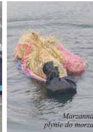
Marzanna płynie do morza